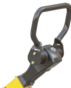
Präzise und sicher bedienbar Komfort-Hebel-Steuerung