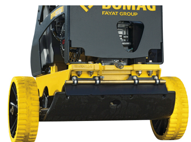
Einfacher und sicherer Transport Transporträder (optional)