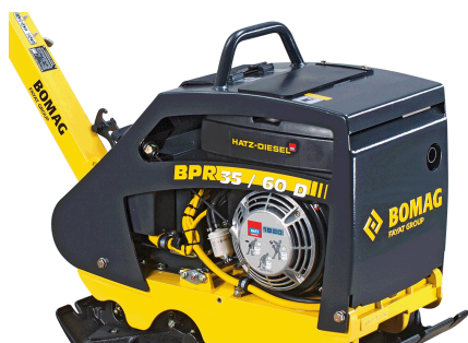
Robust und zuverlässig Bester Komponentenschutz